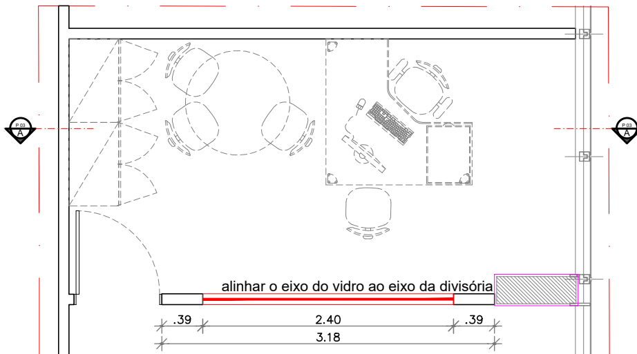
PL BAIXA-Reforma divisória ESCALA .....1/50