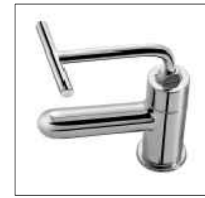
7 TORNEIRA PARA LAVATÓRIO DE MESA PRESSMATIC BENEFIT LEED DOOLA. COD. 0092706 OU SIMILAR. TORNEIRA COM FECHAMENTO AUTOMÁTICO PARA WC PNE (PESSOAS COM NECESSIDADES ESPECIAIS) COM ACIONAMENTO ATRAVÉS DA ALAVANCA