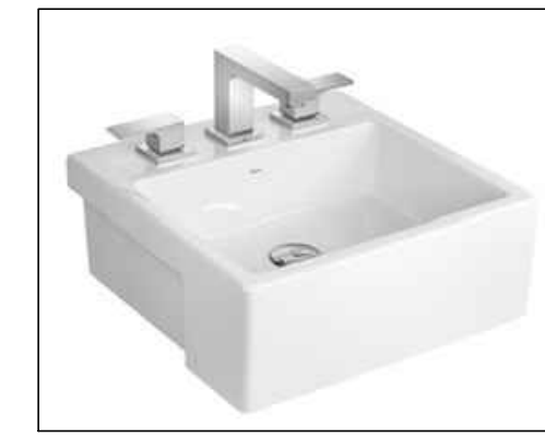
1 CUBA DE SEMI-ENCANATE QUADRADA COM MESA Código L.830

REVISÕES / OBSERVAÇÕES NOTA 01 - em 14/04/2015 Conferir cotas na obra, qualquer dimensão diferente deve ser informada aos responsáveis. Todos os materiais especificados deverão ter amostra para apreciação antes de sua aplicação. Imprevistos que impliquem em alteração.