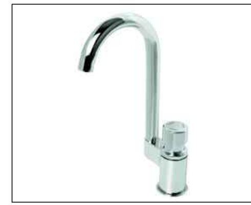
2 TORNEIRA PARA LAVATÓRIO DE MESA FECHAMENTO AUTOMÁTICO BICA ALTA DECAMATIC ECO Código 1175.C