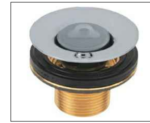
5 TODAS AS CUBAS TERÃO VÁLVULA DE ESCOAMENTO PARA LAVATÓRIO CURVADE COM TAMP. PLÁSTICA Código 1602.C.PLA