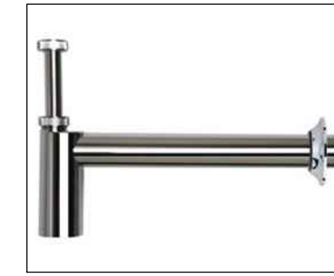
6 BOMBEIRO PARA O WC ESPECIAL SFÃO PARA LAVATÓRIO 1.12 Código 1980.C.100.112