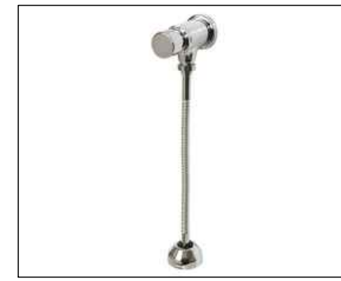
4 VÁLVULA PARA MICROLEVER HORIZONTAL DE FECHAMENTO AUTOMÁTICO DECAMATIC ECO Código 2572.C