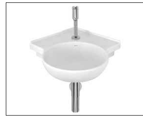
3 LAVATÓRIO DE CANTO SUSPENSO COM MESA Código L.76