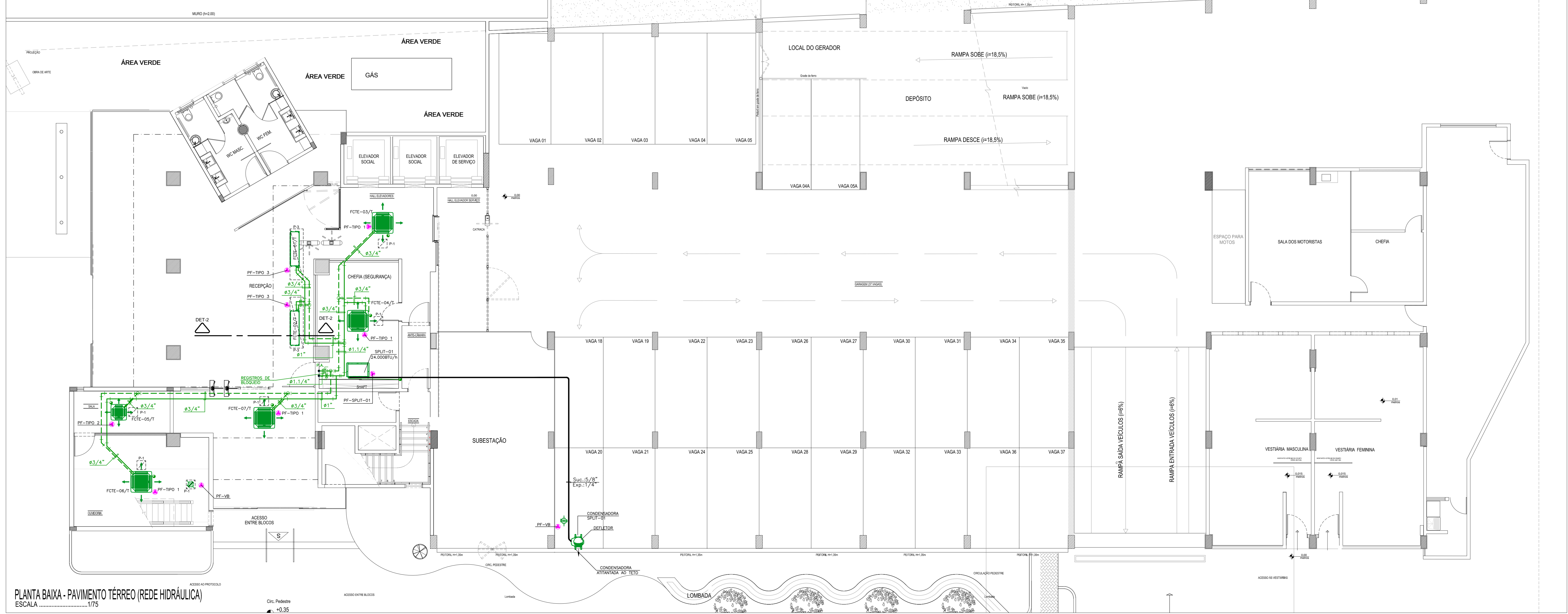
PLANTA BAIXA - PAVIMENTO TÉRREO (REDE HIDRÁULICA) ESCALA 1/75